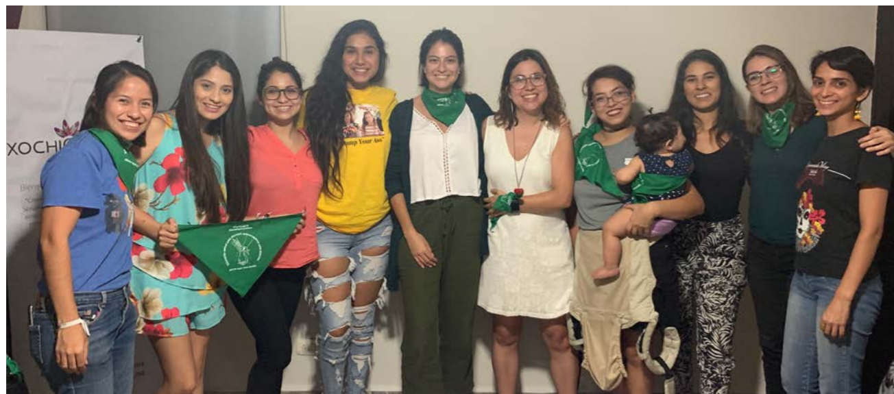
Taller Estigma del Aborto por Balance, A.C.