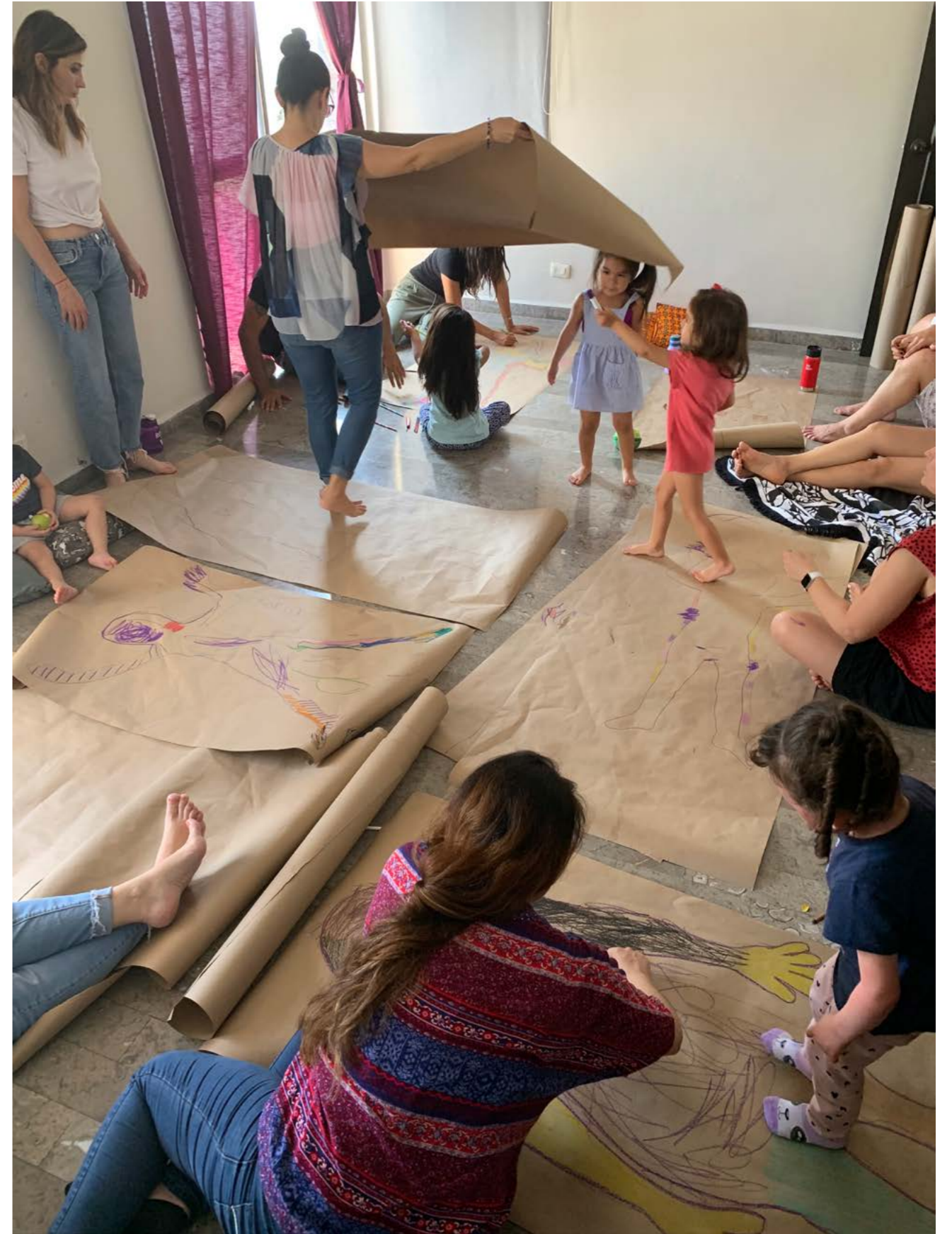
Taller familiar: Aprendiendo a hablar de sexualidad Infantil. Xochiquétzal, Monterrey, Nuevo León.