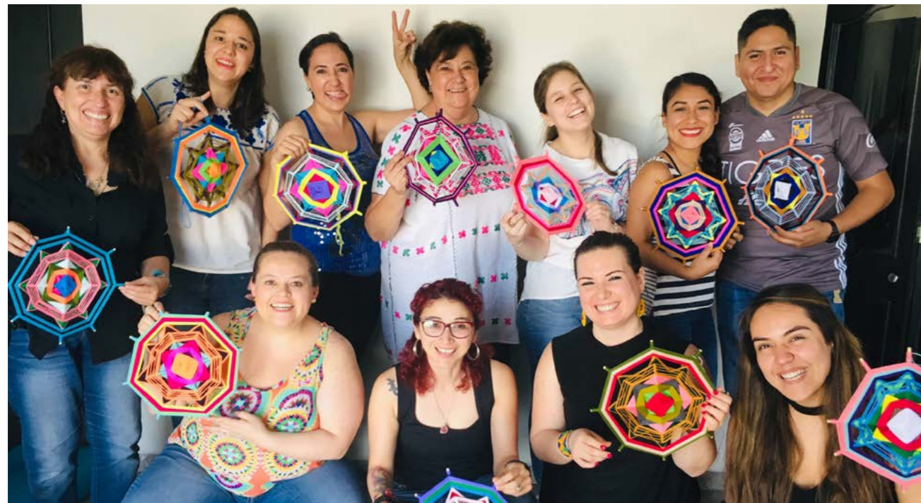
Taller de mandalas tejidos