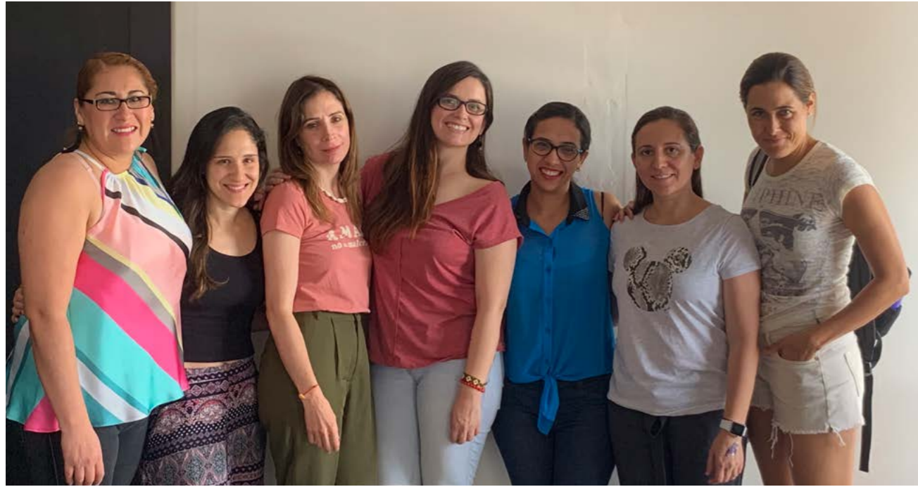
Escuela para madres, padres y cuidadores primarios: Hablemos de sexualidad infantil, Xochiquétzal, Monterrey, Nuevo León