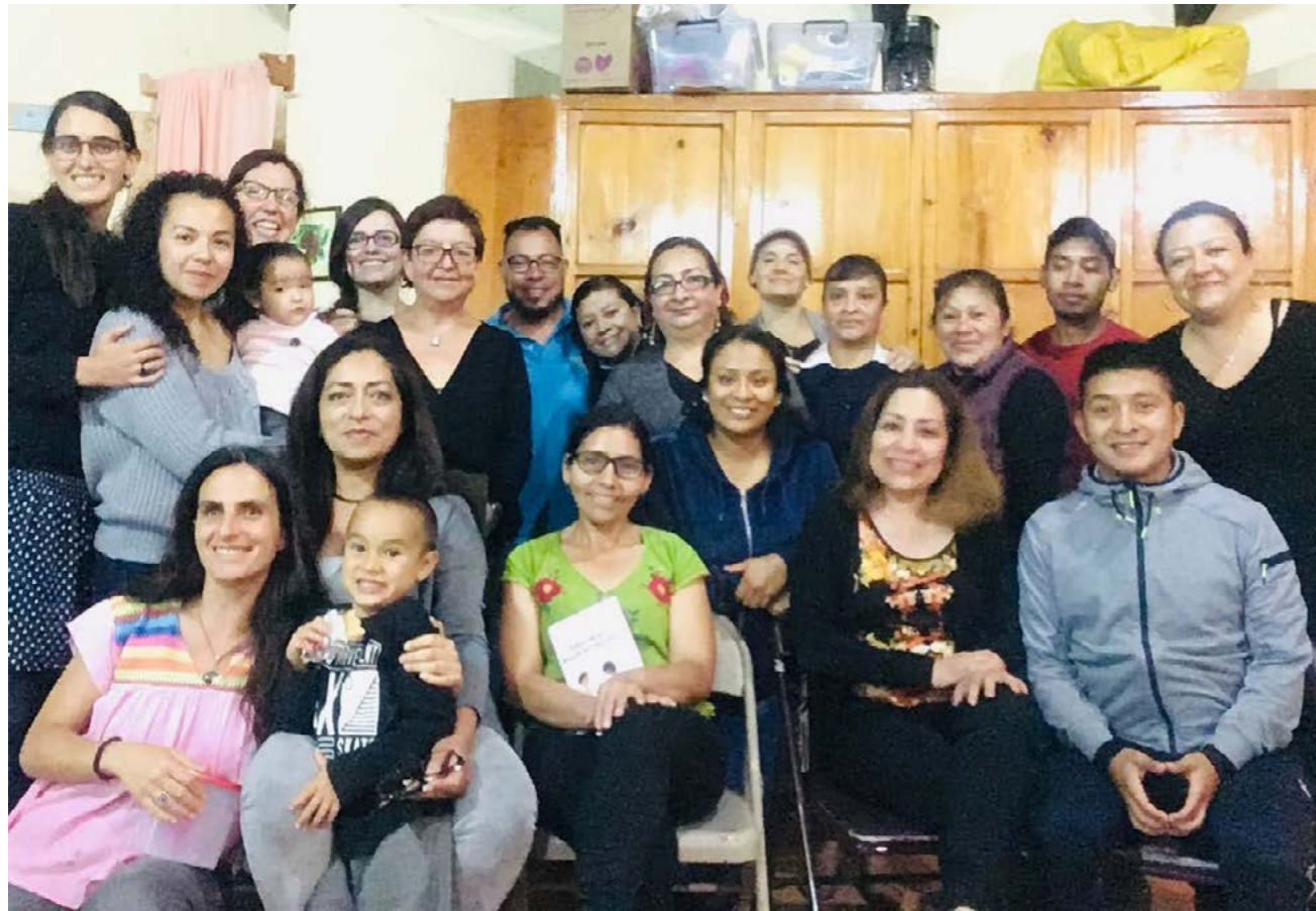
Capacitación a docentes, Escuela Pequeño Sol, San Cristóbal de las Casas, Chiapas