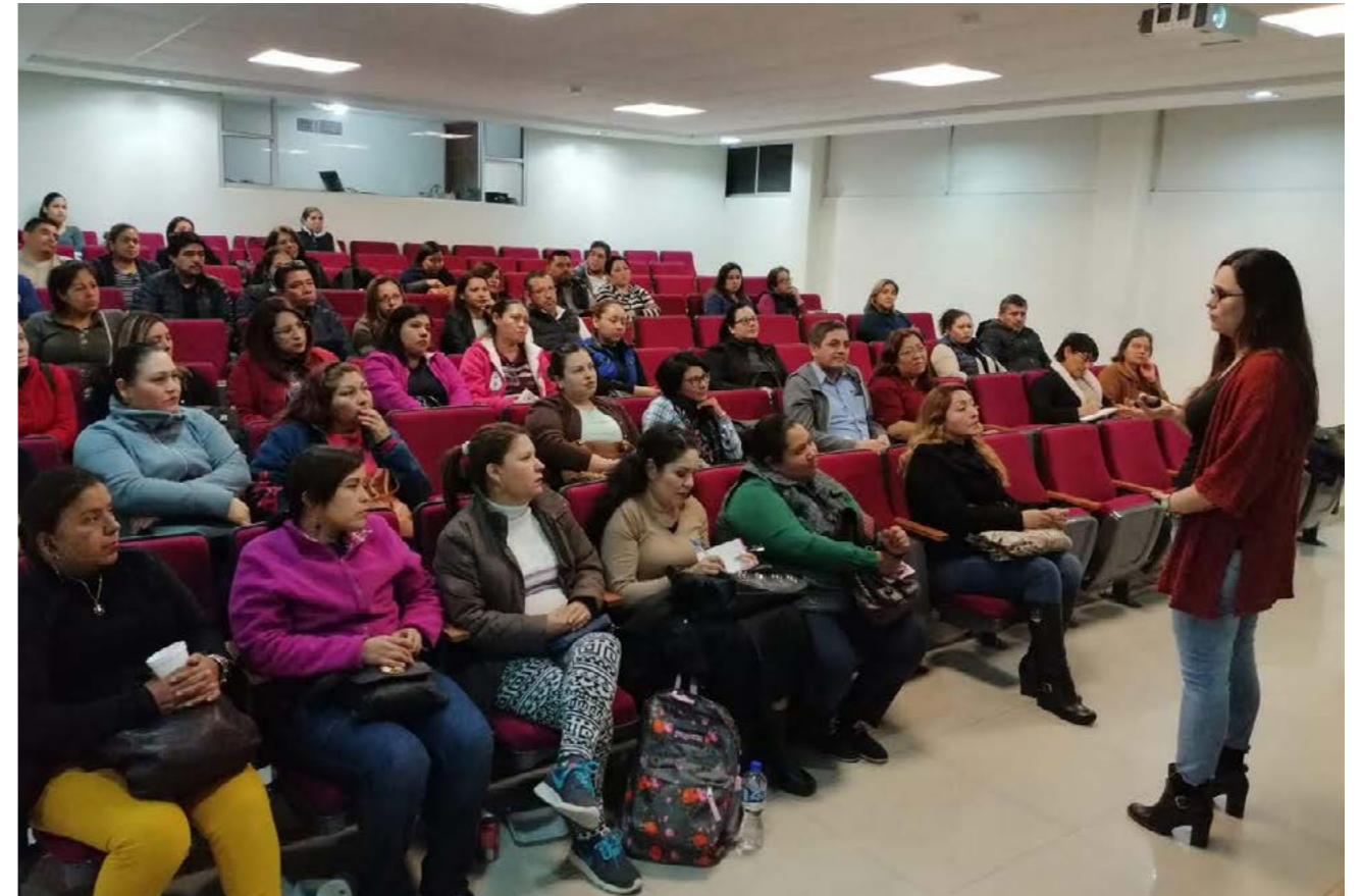
Plática: Escuela para padres y madres de sexualidad adolescente. Prepa 23 Unidad Santa Catarina, Nuevo León.