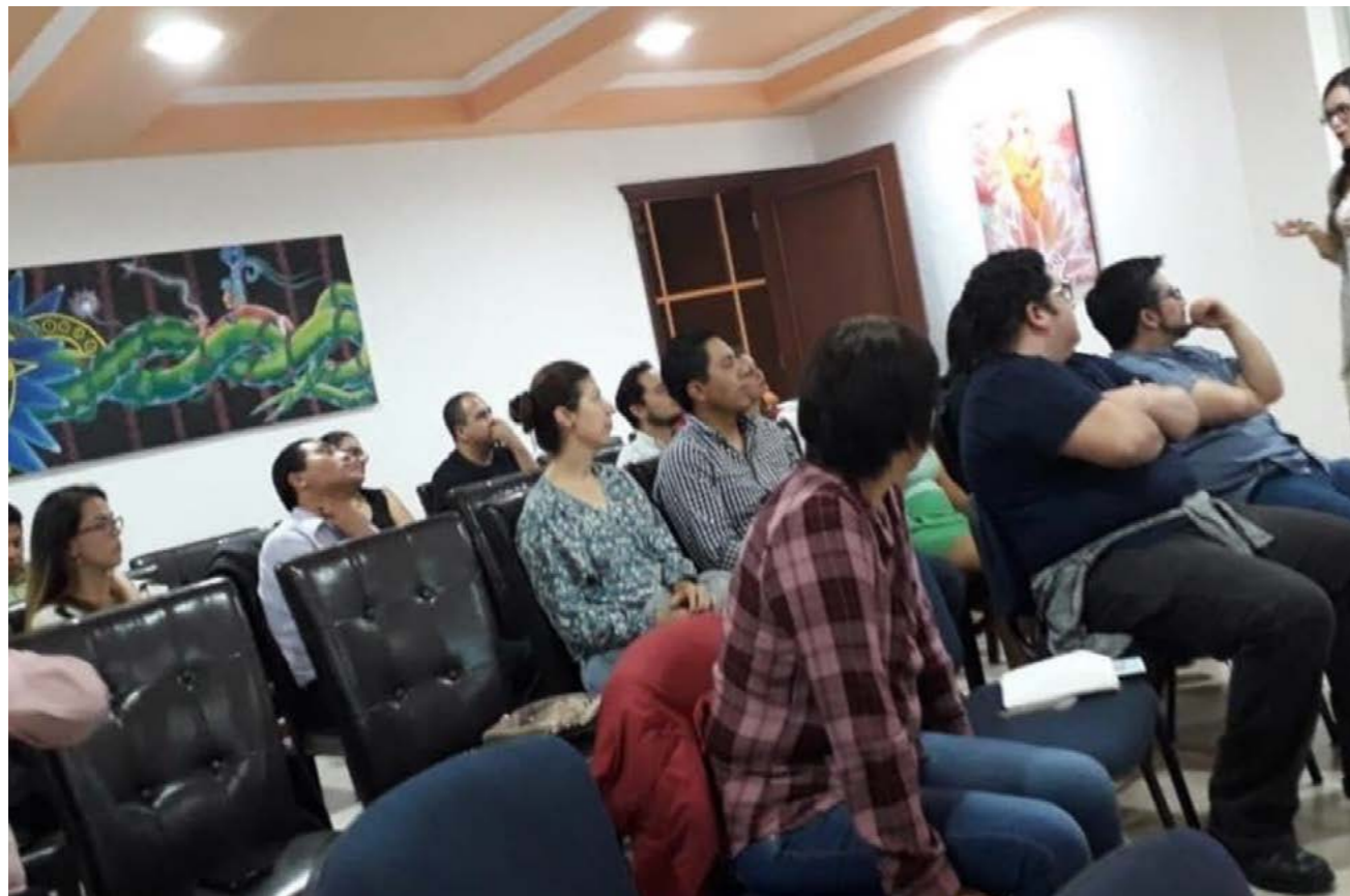
Conferencia para pediatras: Hablemos de Sexualidad Infantil, Colegio de Pediatría de San Cristóbal de las Casas, Chiapas.