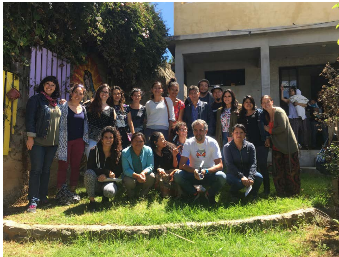
Taller para madres y madres Hablemos de Sexualidad infantil, Casa Comunitaria Raíz del viento. San Cristóbal de las Casas, Chiapas

En total impactamos directamente a 206 mujeres, 54 hombres, así como 7 niñas y 1 niño que recibieron los talleres o conferencias, calculamos que el impacto indirecto que tienen todas estas personas adultas es de 780 niños y niñas que tienen a adultos más preparados en sus vidas para acompañarles en su desarrollo óptimo y seguro.