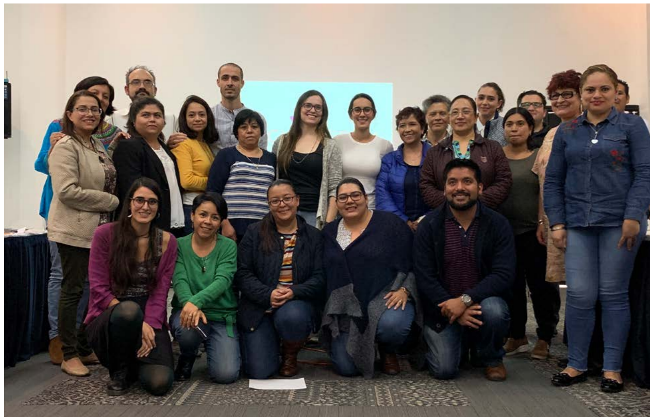
Taller para madres y padres: Hablemos de sexualidad infantil, Congreso de Pediatría de San Cristóbal de las Casas, Chiapas.