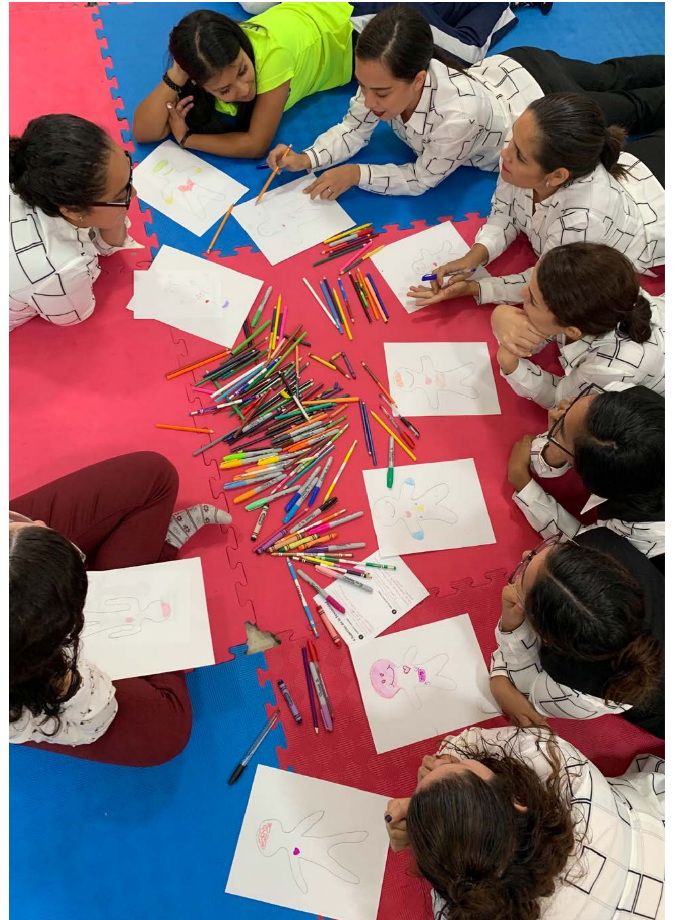
Taller para docentes de sexualidad infantil, Instituto Edinburgh, San Nicolás de los Garza, Nuevo León