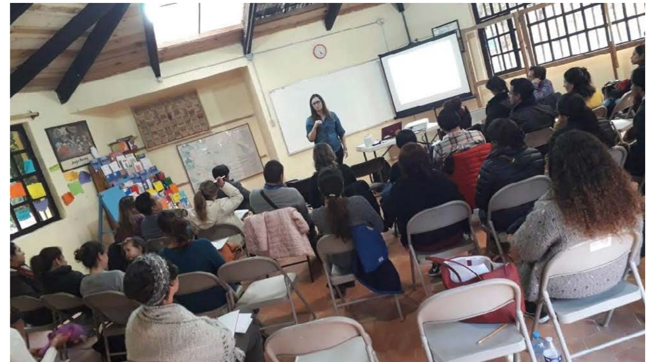
Conferencia: Hablemos de Sexualidad Infantil, Escuela Pequeño Sol, San Cristóbal de las Casas, Chiapas