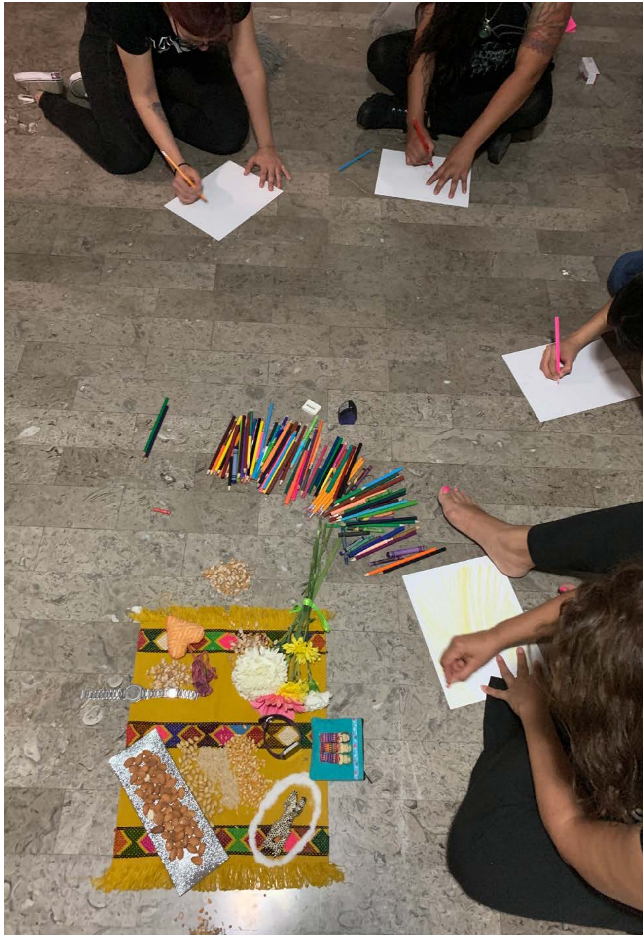
Jefas de Familia SEDESOL, Monterrey, Nuevo León.