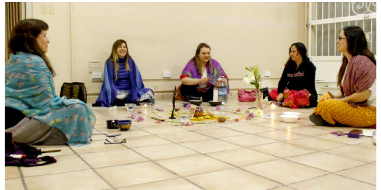
Círculo de mujeres, Monterrey, Nuevo León.