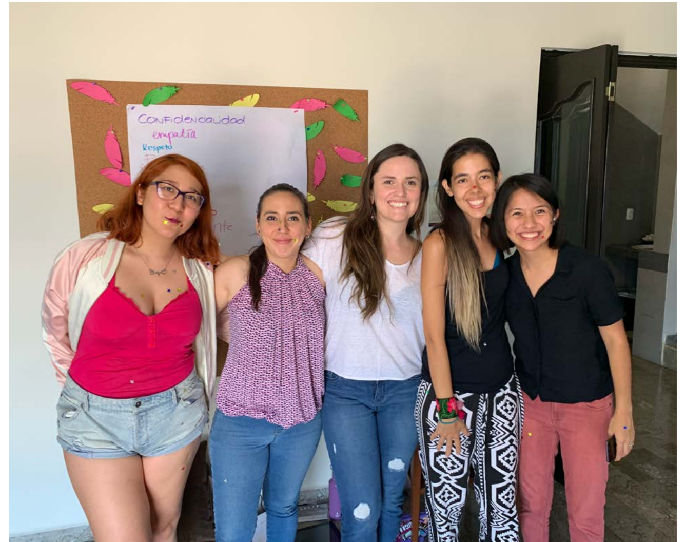
Taller Autoestima y Sexualidad, Xochiquétzal, Monterrey, Nuevo León.