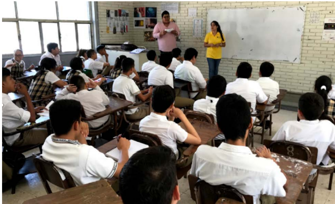
Taller Sexualidad adolescente, Esc. Sec. No. 10 "Francisco González Bocanegra", San Nicolás de los Garza, Nuevo León

Directamente fueron beneficiadas 553 mujeres y 89 hombres adultos, así como 160 mujeres y 193 hombres adolescentes.