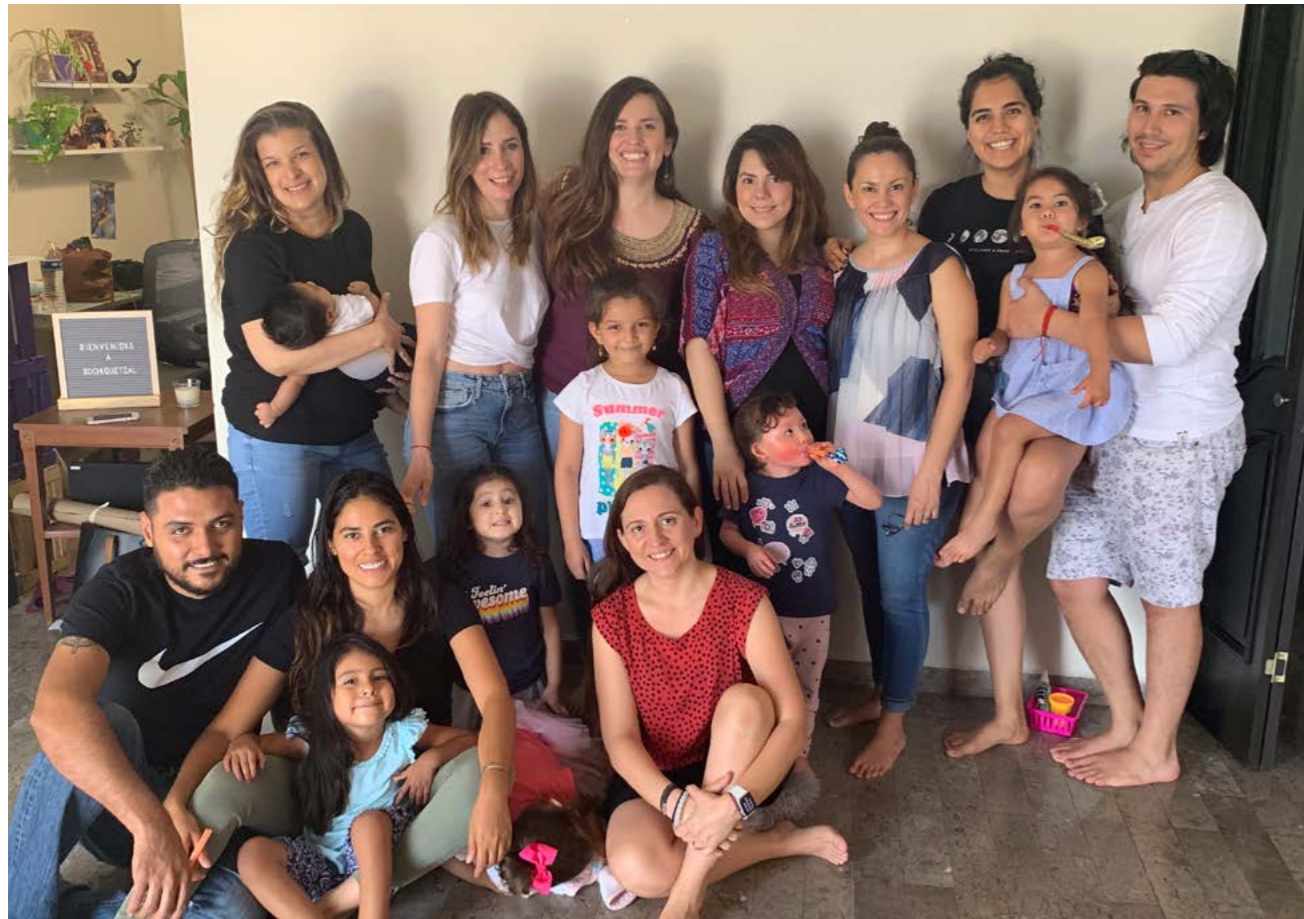
Taller familiar: Aprendiendo a hablar de sexualidad Infantil. Xochiquétzal, Monterrey, Nuevo León.