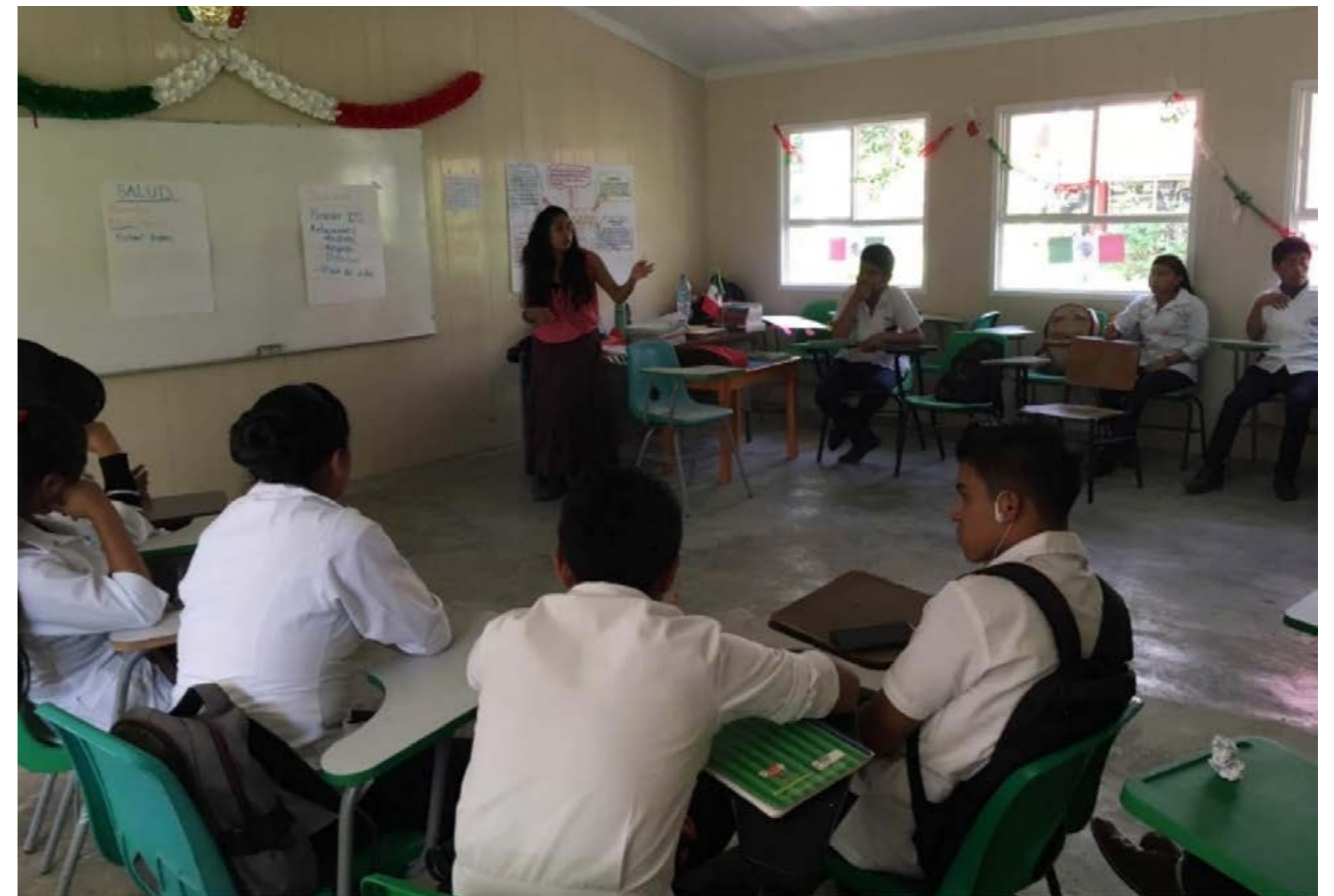
Taller de autocuidado para jóvenes, CECyT plantel 18, Chenalhó, Chiapas.