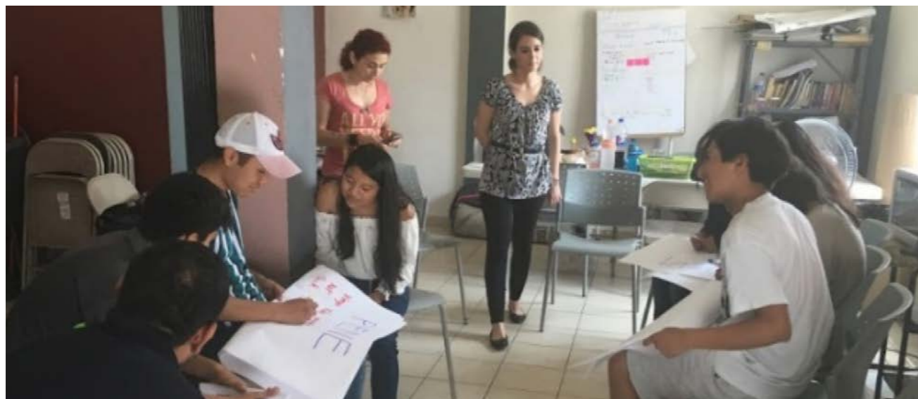
Taller con jóvenes, Vía Educación, Santa Catarina, Nuevo León