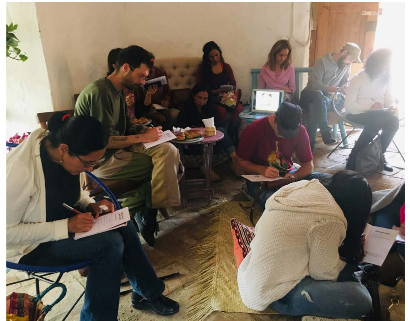
Taller para madres y madres Hablemos de Sexualidad infantil, Escuela Waldorf, San Cristóbal de las Casas, Chiapas