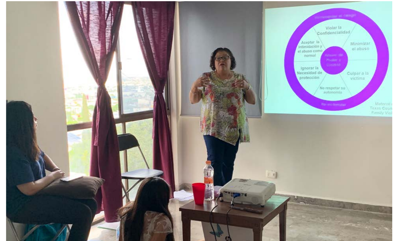
Violencia en el noviazgo por Alternativas Pacíficas, A.C.