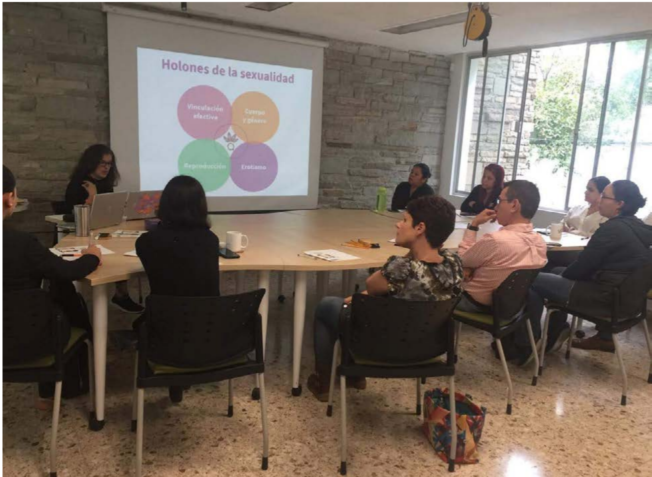
Taller Hablemos de sexualidad infantil, yCo, Monterrey, Nuevo León.