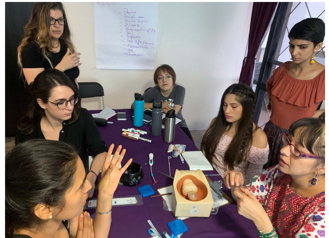
Capacitación y actualización en Métodos Anticonceptivos por Fundación Marie Stopes, A.C.