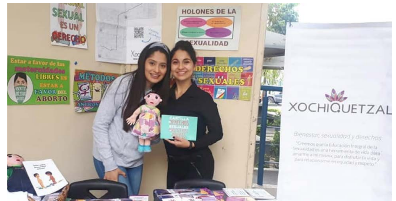
Feria de instituciones con la finalidad dar a conocer la dependencia para las prácticas profesionales de las estudiantes, noviembre 2019