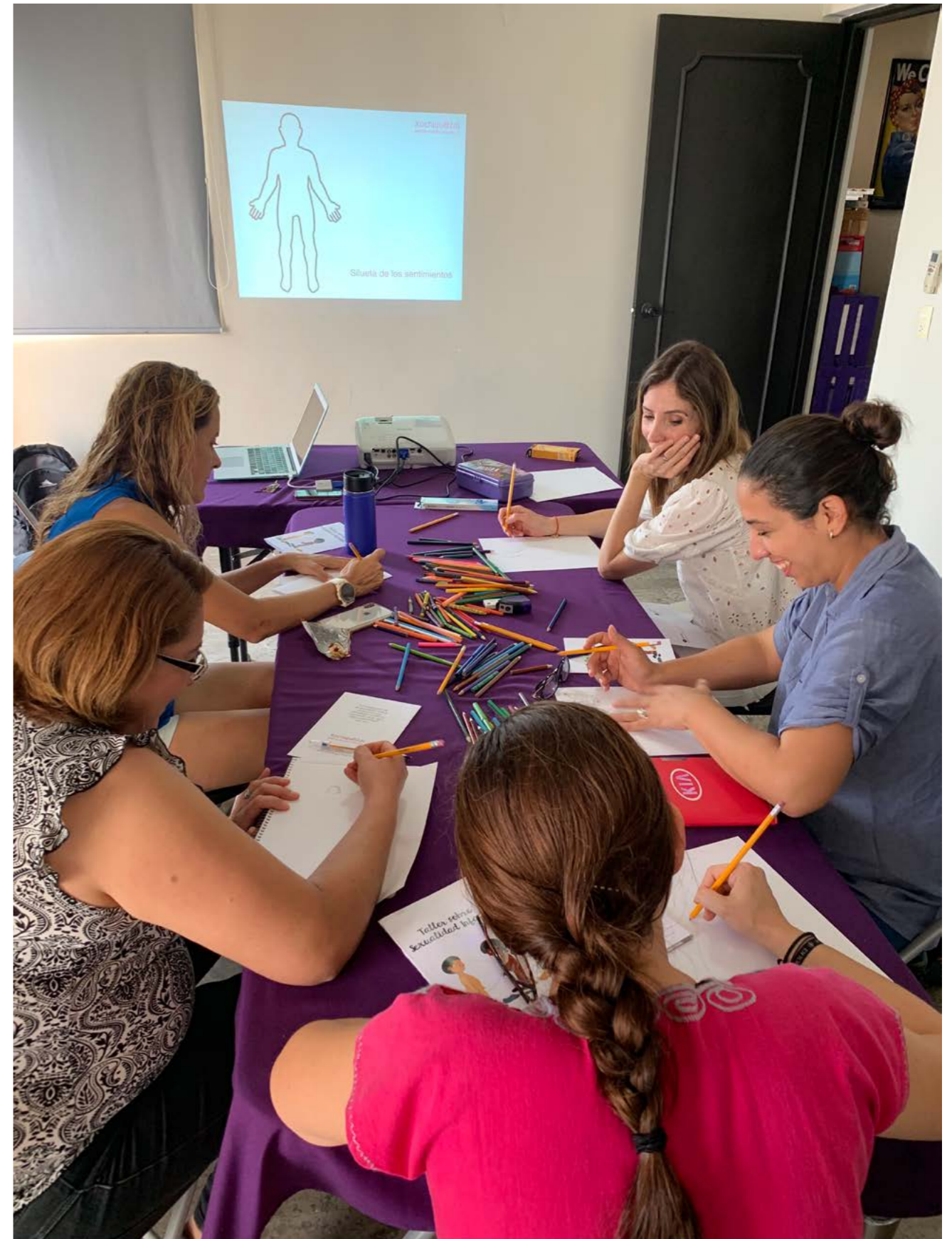
Escuela para madres, padres y cuidadores primarios: Hablemos de sexualidad infantil, Xochiquétzal, Monterrey, Nuevo León.