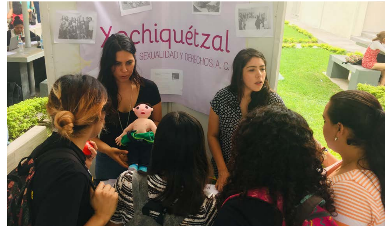
Presentación de la organización, en la feria de instituciones, mayo 2019

Durante el año realizamos varias actividades que sumaron esfuerzos de algunas personas voluntarias que fueron apoyando en actividades específicas durante el transcurso del año. Uno de los logros más importantes es que concretamos un convenio con la Facultad de Trabajo social y Desarrollo humano para que las y los estudiantes de su institución realicen sus prácticas profesionales con nosotras, iniciamos con nuestra primera practicante en agosto del 2019 quien termina en mayo del 2020 y para enero del 2020 se unirá una segunda practicante de la misma universidad.